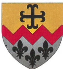
Commune de Bettendorf