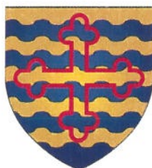
Commune de Reisdorf